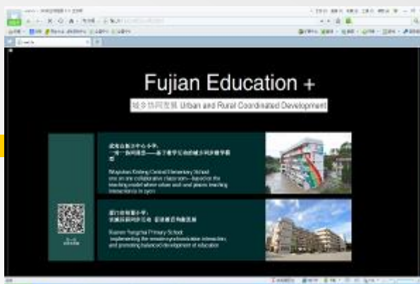
案例1：实施远程同步互动 促进教育均衡发展