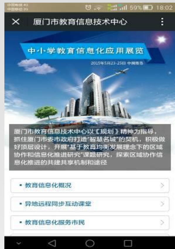
案例2：“云”架桥 两岸 实现文脉融合梦